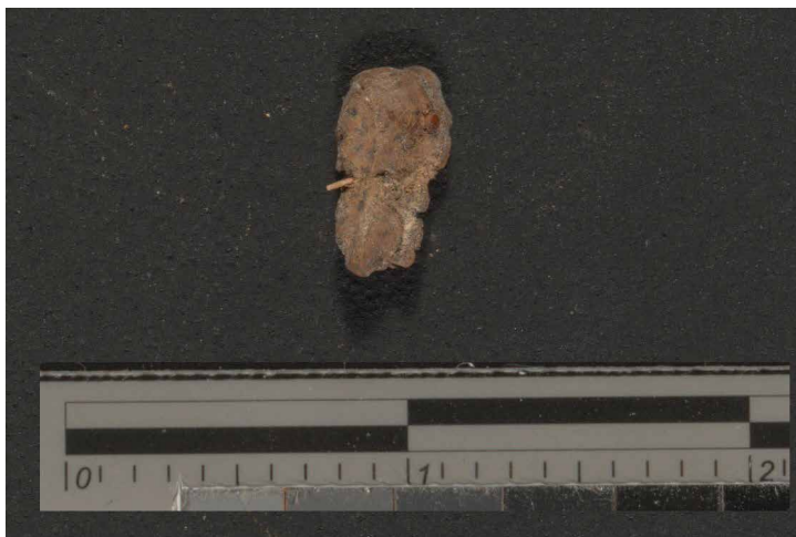
איור 4. יריעת תפילין מקופלת הנמצאת באוסף רשות העתיקות; שימו לב לחוט המבצבץ מביין קיפוליה