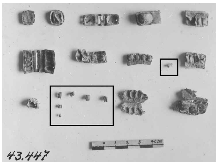
איור 2. צילום PAM 43.447 ובו (מוקפות כאן בריבועים) יריעות מקופלות שיצאו משני בתי תפילין