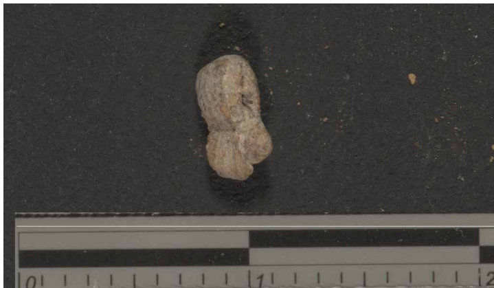
איור 3. יריעת תפילין מקופלת הנמצאת באוסף רשות העתיקות; שימו לב לחוט המבצבץ מביין קיפוליה